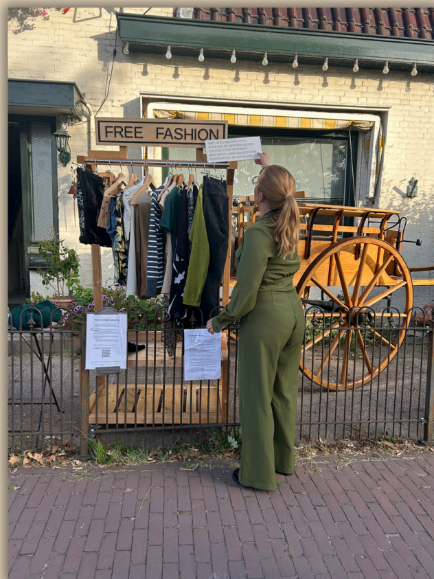
Free Fashion, Molenstraat

Er is wereldwijd namelijk genoeg kleding om de komende zeven generaties (!) aan te kleden. En toch blijven we nieuwe kleding produceren, terwijl er zoveel moois ongebruikt blijft liggen.