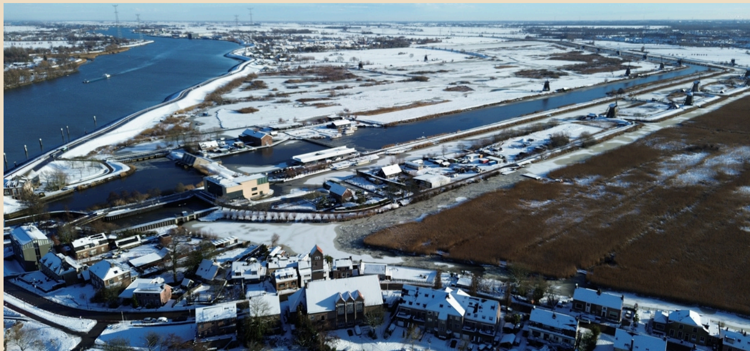
Kinderdijk vanuit de lucht op 6 februari 2025

5E JAARGANG - NUMMER 1 - MAART 2026 VERSCHIJNT 4X PER JAAR