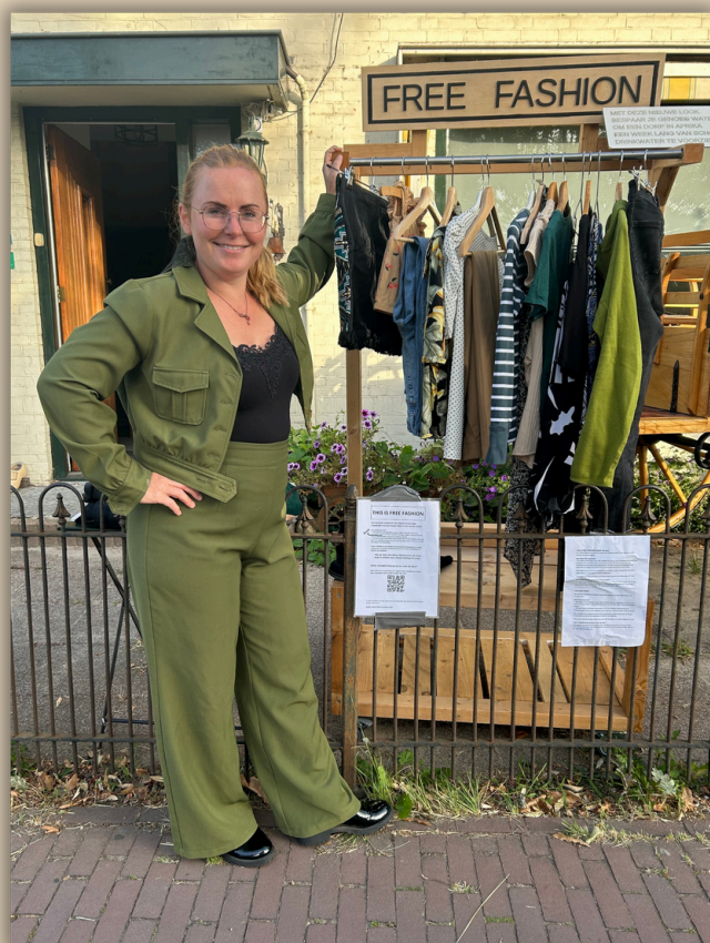
Free Fashion, Molenstraat