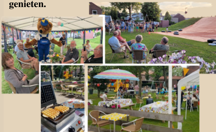
De speeltuin als plek voor ontmoeting van jong en oud in het dorp.

Alweer een paar jaar geleden droomden we met z'n allen over de toekomst van ons dorp. Tijdens een bijeenkomst van de gemeente in ons dorp dachten we na over wat wij belangrijk vinden voor ons dorp. Voor ons, als vrijwilligers van de speeltuin, was één ding meteen duidelijk: een plek waar alle Kinderdijkers – jong én oud – samenkomen om te spelen, te ontmoeten en te genieten.