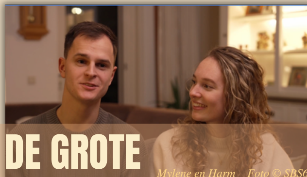
Mylene en Harm