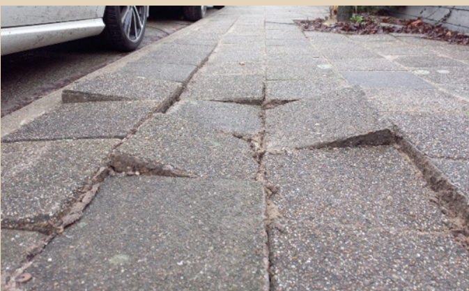
Zo erg is het nog niet in Kinderdijk!