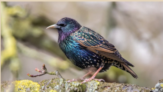
De spreeuw - Sturnus vulgaris .

Richard Slagboom, Vogelwerkgroep 'Natuur en Vogelwacht De Alblasserwaard'