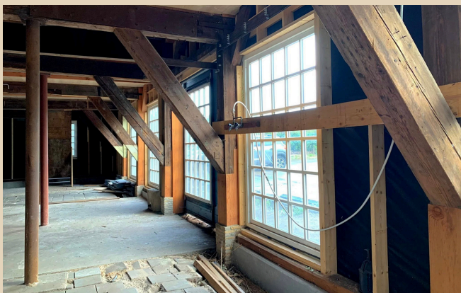
Foto's van het Pothuis genomen tijdens Open monumentendag 13 september 2025.