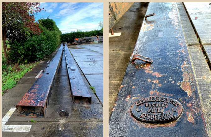
Ijzeren molenroeden op het Potterrein. Foto's genomen tijdens Open monumentendag 13 september 2025.

De garage van de bussen was in de grote loods van de Potwerf. Deze busgarage verhuisde in 1948 naar een locatie gelegen aan de Puntweg. De naam van de busonderneming was 'De Twee Provinciën'. Na de Tweede Wereldoorlog kreeg het Potterrein nieuwe bestemmingen. Eerst was daar het timmerbedrijf van de Gebroeders van den Perk. Zij verkochten hun onderneming aan 'Timmerbedrijf De Jager'. Deze onderneming gaf het stokje door aan Aannemersbedrijf Stam en Zn.